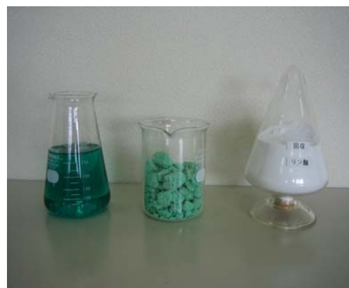
(上図)左から順に、無電解ニッケルメッキ廃液脱水固化したニッケル化合物、粉末状に加工したリン