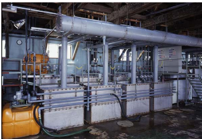
(無電解ニッケルメッキ廃液処理装置)